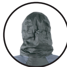
GORRO DESMONTABLE CON DOBLE AJUSTE REGULABLE