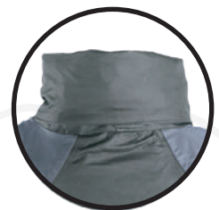
BOLSILLO EN CUELLO PARA GORRO DESMONTABLE