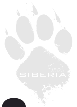
TABLA DE MEDIDAS