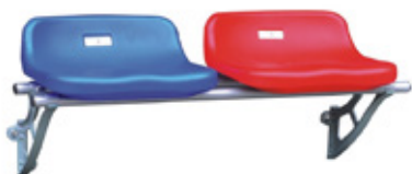
MONTAJE A CONTRA HUELLA