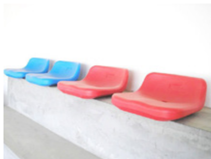
MONTAJE A HORMIGÓN