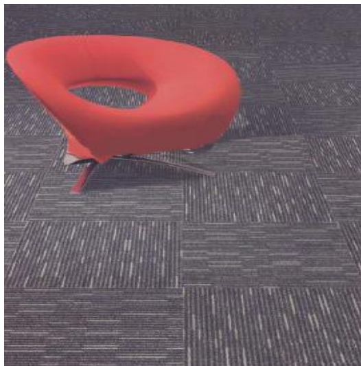
Color (FP3096 - 910g/m 2 )